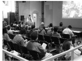
◀ 最終選考会の様子

「市民活動アワード2010」において市民投票による一次選考を通過し、最終選考会で各賞を受賞した9つのエピソードの発表団体を紹介します。