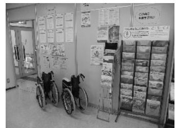
▲入口の右手に設置されている骨プロラック