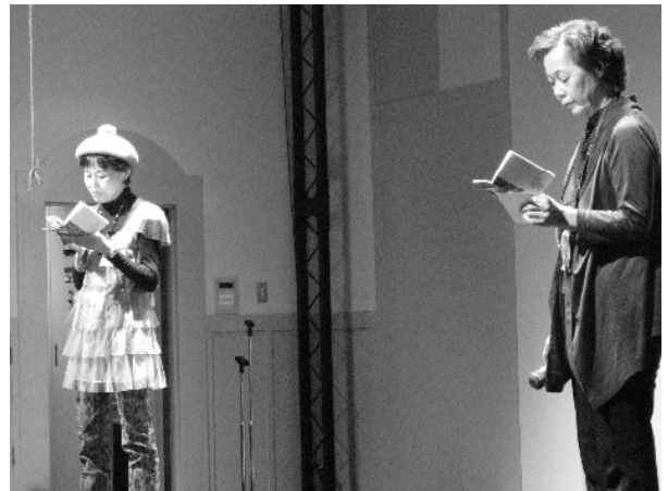
▲ステージ発表の様子

最終選考会の会場は、サポートセンターの地下にある、「市民活動シアター」。ミラーボールが輝き、赤じゅうたんが敷かれた、いつものサポセンとはちょっと異なる雰囲気の中、1団体8分の持ち時間で行われたステージ発表では、口頭発表の他、ビデオレターやダンス、二人で掛け合いをしながら発表を進めていくなど、各団体の様々な工夫を凝らしたプレゼンテーションが繰り広げられました。