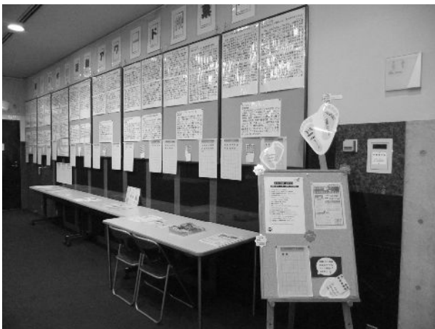
▲市民活動アワード2010一次選考・館内投票会場 (サポートセンター5階展示スペース)

記念すべき第1回目となる「市民活動アワード2010」には、公募により、12団体から18のエピソードが寄せられ、10月9日~25日の間にサポートセンター館内とホームページ上で行った一次選考で、市民の皆さんから519票もの投票がありました。