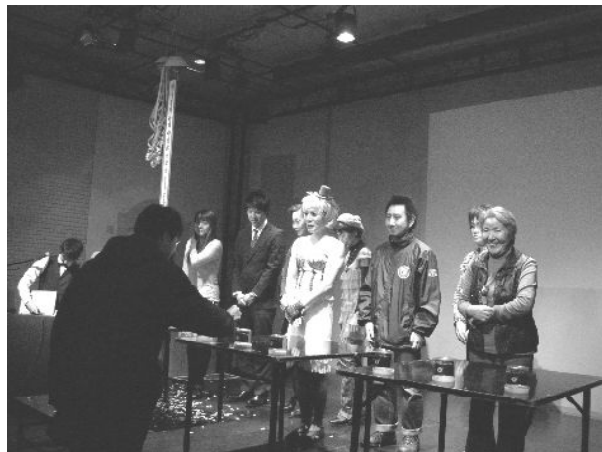
▲来場者に投票を呼び掛ける各団体の皆さん (市民活動アワード2010最終選考会にて)

「母子家庭の子供達も、父子家庭の子供達も平等に支援をうけられるよう求める意見書」を国政に提出するよう求める請願書を仙台市政と宮城県政および県内の34市町村へ提出。その後、平成21年11月に他の地域で活動されていた父子家庭の方と共に全国父子家庭支援団体連絡会を設立し、地方自治体と国政に対し政策提言を行っています。