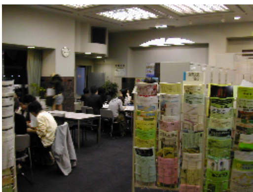
5階交流サロンの様子

新しくなったサポセンの交流サロンは、3・5・7階の3ヶ所にあります。メインは5階で、ロッカーが併設されているほか、インターネットに接続できるスペースもあります。ガラス張りなので外の眺めは良いですし、他にも壁が大理石だったり、本町サポセンと比べて洗練された雰囲気がなりました。けれど、この交流サロンが市民活動に関わっている皆さんのフリースペースであり、交流の場であることに変わりはありません。どうやら今日もたくさんの方で賑わっているようです。さて、どんな出会いが生まれるかワクワクしませんか？