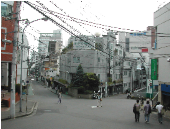
錦町公園から見たサポセン

サポセンがこの本町に開館して、もつすぐ丸7年が過ぎようとしています。今年9月には移転することが決まり、惜しまれつつこの本町サポセンはその歴史に幕をとじることになりました。見た目は地味でも、多くの利用者のみなさんに「なんとなく愛着があるんだよね」と言わせてしまつ、独特の存在感をかもし出すこの建物、別れを惜しむ声も多くある中で、スタツプならではの視点で、「ありがとう本町サポセン」と題して、3回に渡りいろいろな角度から見たサポセンの写真をご紹介したいと思います。